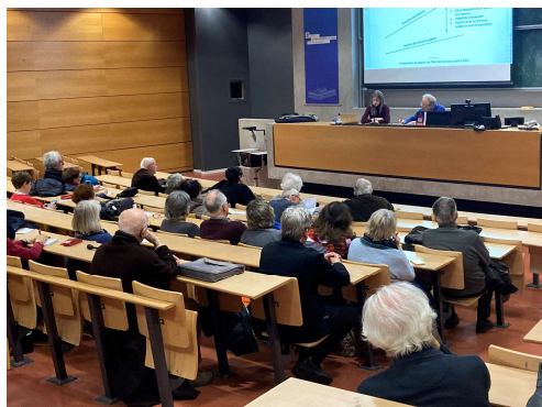
Un auditoire attentif